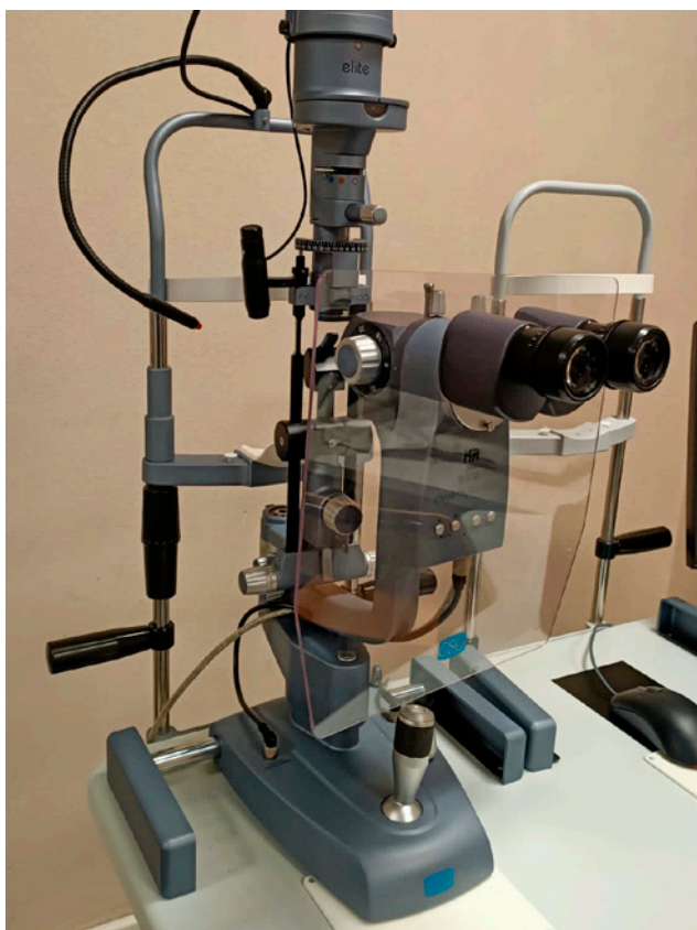
Figura 3. Protezione con plexiglass tra operatore ed esaminatore.

Queste protezioni aggiuntive, come ad esempio plexiglass o similari di parafiato trasparenti per le lampade a fessura, consentono di avere un'ulteriore barriera protettiva dalle droplets tra l'esaminatore e l'operatore (fig. 3).